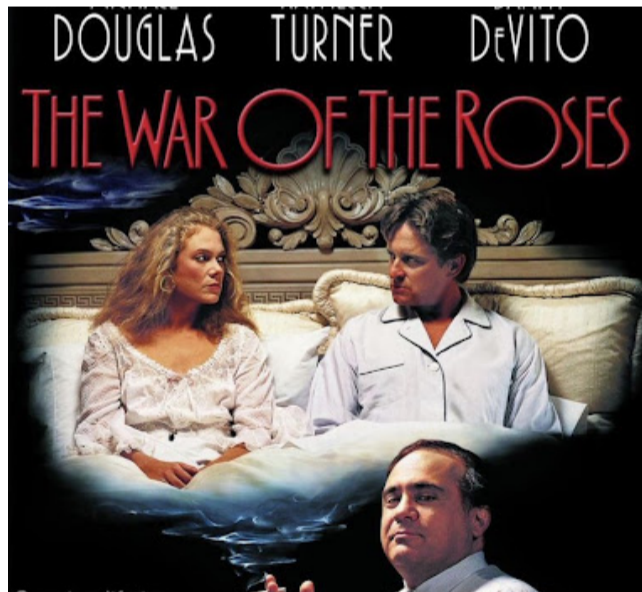
SOPRA. IL FILM CULT DEGLI ANNI 80, DA CUI È STATO RIPRESO "I ROSES". A DESTRA

Il film non affronta tanto una questione di genere, quanto una riflessione più profonda sulla dinamica della coppia sotto pressione: vivere insieme, crescere i figli e condividere gli spazi, dimenticando spesso chi si ha accanto. A volte crediamo che il tradimento sia so-