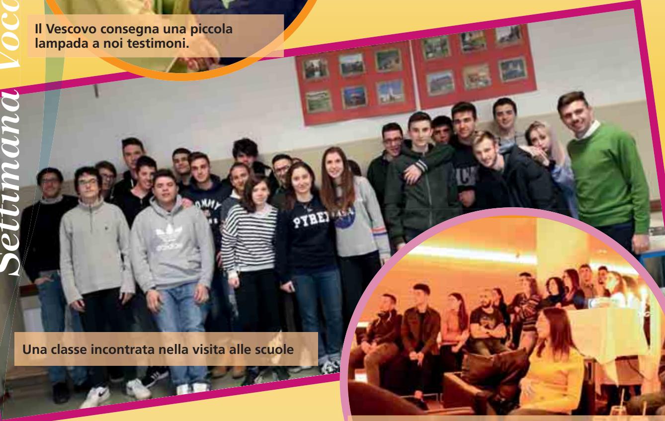
Una classe incontrata nella visita alle scuole