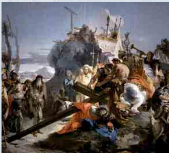
GIAMBATTISTA TIEPOLO LA SALITA AL CALVARIO (1740 - CHIESA DI SANT'ALVISE VENEZIA)

Questo tempo di prova si apra sempre alla speranza del Risorto