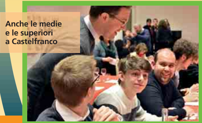
Anche le medie e le superiori a Castelfranco