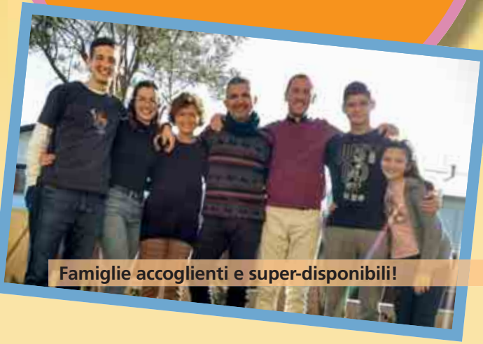
Famiglie accoglienti e super-disponibili!