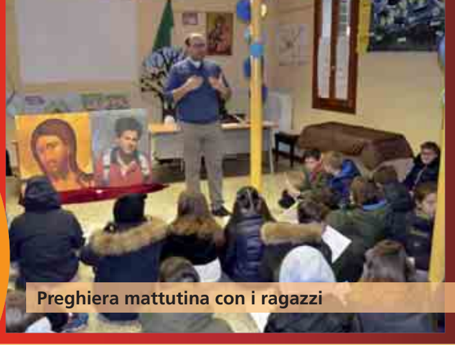
Pregiera mattutina con i ragazzi