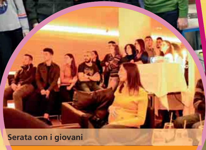
Serata con i giovani