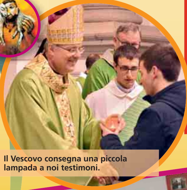
Il Vescovo consegna una piccola lampada a noi testimoni.