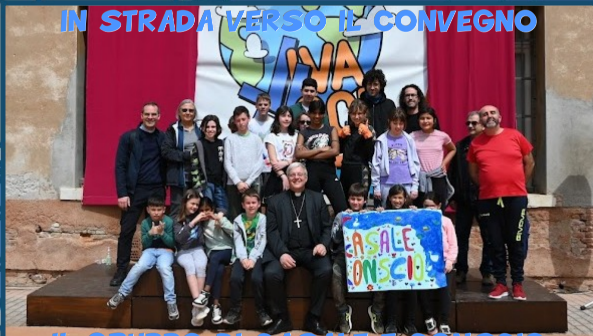
IL GRUPPO DI CASALE E CONSCIO