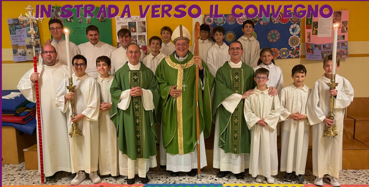
IL GRUPPO DI MERLENGO, PADERNO E PONZANO