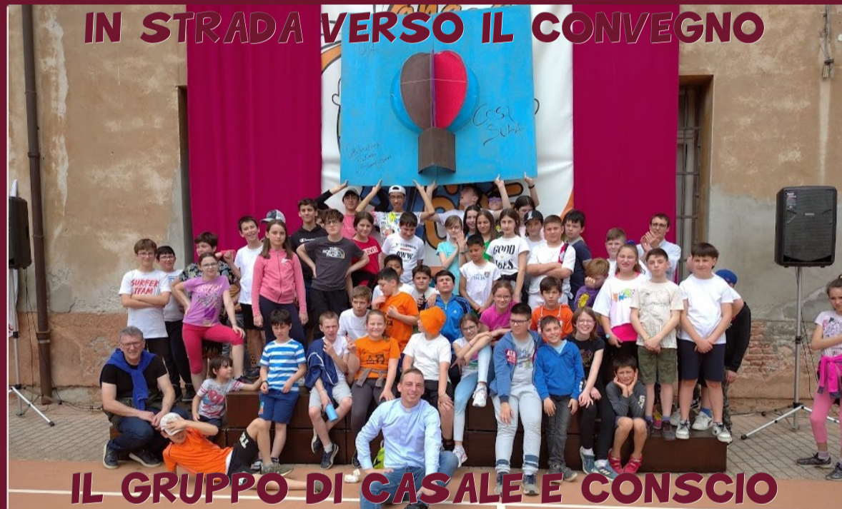
IL GRUPPO DI CASALE E CONSCIO