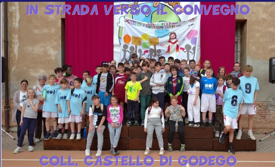
COLL. CASTELLO DI GODEGO