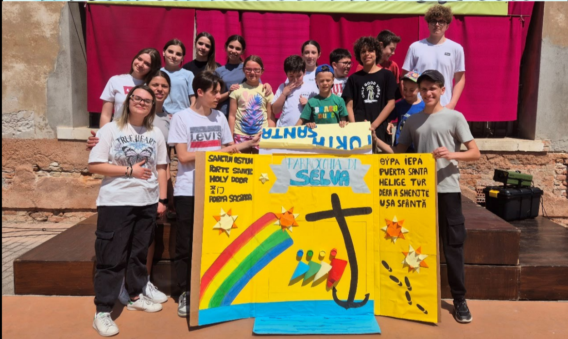
LA PARROCCHIA DI SELVA