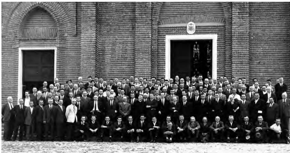
1964 – Incontro di studio e preghiera a Montebelluna