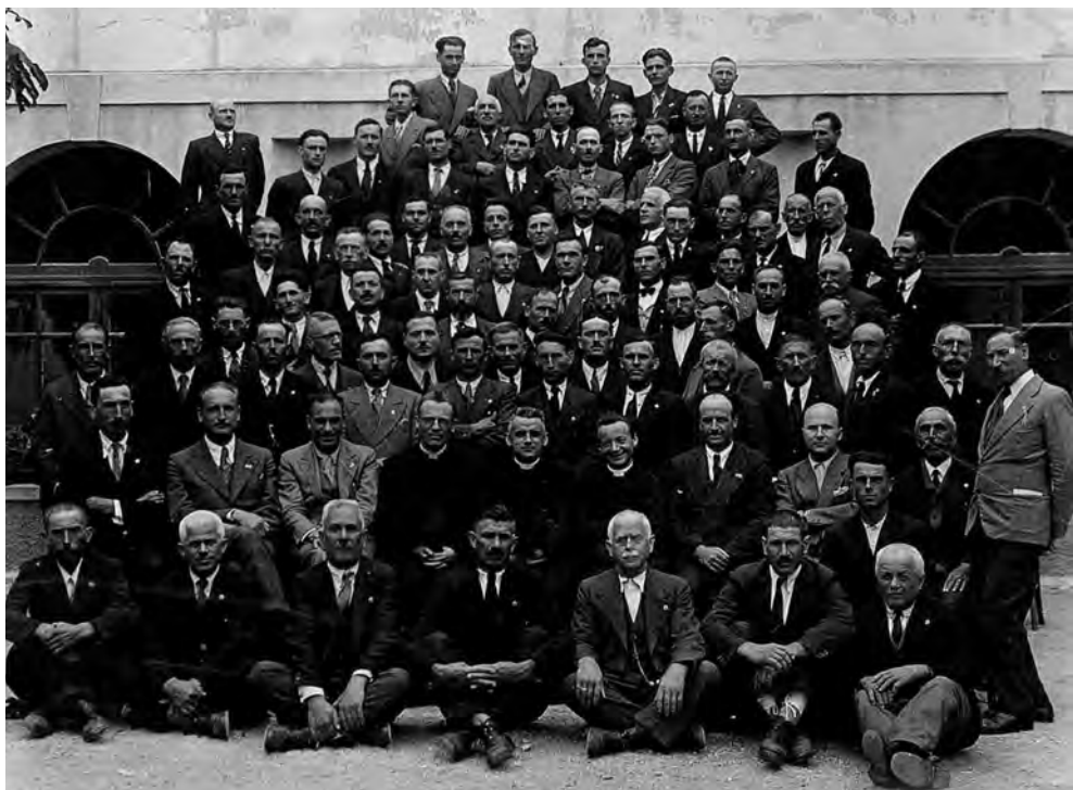
Corso di studio per dirigenti a Possagno, agosto 1937

Quest'anno è singolarmente documentato. Particolare importanza viene data alla festa della famiglia del 10 gennaio. Rispetto alla vita associativa da una parte si raccomanda la frequenza almeno quindicinale delle riunioni e dall'altra si rinnovano le visite alle Unioni parrocchiali. Una forte attenzione viene riservata ai dirigenti foraniali, accompagnati con apposite e frequenti