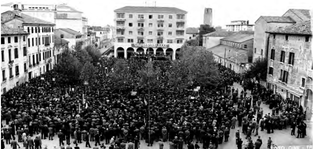
1957 - Celebrazione del 35° dalla fondazione

Dati: 6.909 iscritti in 237 associazioni.