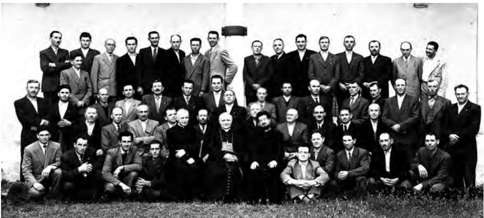
Tre giorni di studio 1954

La tre giorni per dirigenti sull'importanza della formazione spirituale si tiene in Seminario (si sperava di tenerla in villa Ciardi a Quinto, struttura che doveva essere acquistata dalla diocesi per diventare Casa di esercizi, ma l'opera-