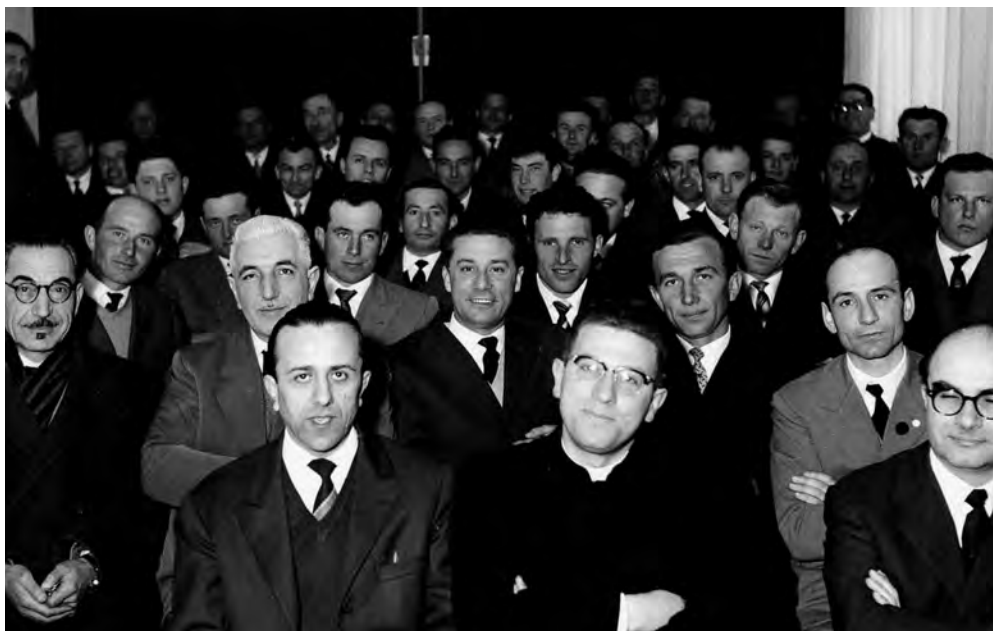
Assemblea del 1962