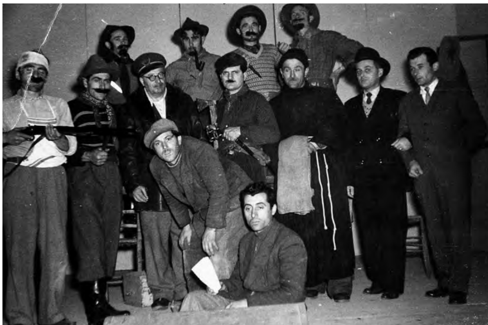
1954 - Filodrammatica di Loreggia