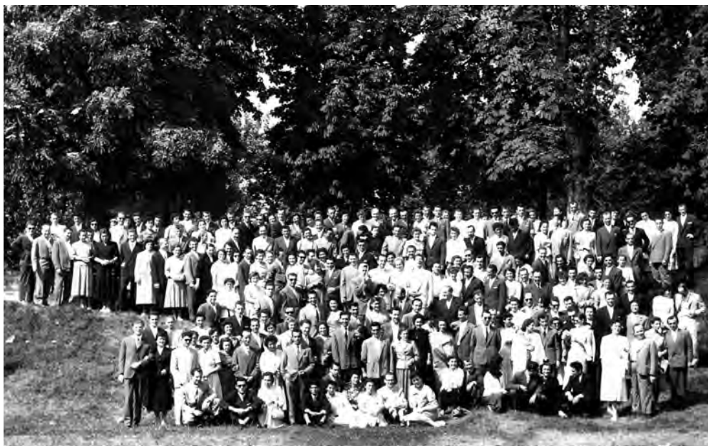
1958 – Convegno dei giovani sposi

Dati: 6.674 iscritti in 240 associazioni.