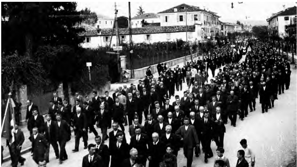
Congresso eucaristico, 10 ottobre 1937

Dati: 5.216 iscritti in 170 associazioni, di cui 22 nuove. Abbonamenti a "Noi uomini" 988 e a "Viri isti pacifici" 578. Nelle 112 associazioni esaminate sono state tenute circa 16.800 lezioni di Cultura religiosa. I partecipanti sono stati 2.993 tesserati e 782 non tesserati; esaminati in forania 1.544; ammessi all'esame diocesano 590, ma decideranno di presentarsi solo 386.