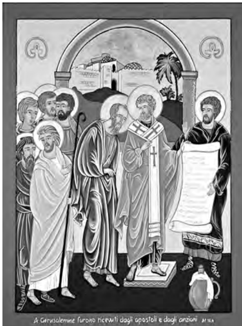
A Gerusalemme furono ricevuti dagli apostoli e dagli anziani. 15:14

Allora parve bene agli apostoli e agli anziani con tutta la chiesa, di scegliere tra di loro alcuni uomini da mandare ad Antiochia con Paolo e Barnaba: Giuda, detto Barsabba, e Sila, uomini autorevoli tra i fratelli. E consegnarono loro questa lettera: «I fratelli apostoli e anziani, ai fratelli di Antiochia, di Siria e di Cilicia che provengono dal paganesimo, salute. Abbiamo saputo che alcuni fra noi, partiti senza nessun mandato da parte nostra, vi hanno turbato con i loro discorsi, sconvolgendo le anime vostre. È parso bene a noi, riuniti di comune accordo, di scegliere degli uomini e di mandarveli insieme ai nostri cari Barnaba e Paolo, i quali hanno messo a repentaglio la propria vita per il nome del Signore nostro Ge-